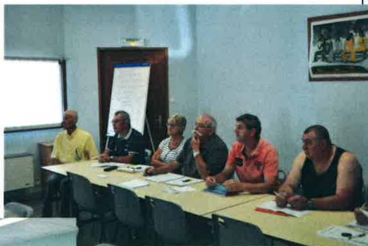
Le bureau , et les chasseurs attentifs.

dans la nouvelle « cabane » des chasseurs au stade de PACT.