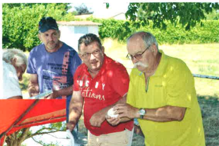
Le président au travail .....

Rendez vous pris pour l'année prochaine même lieu, même date !!!