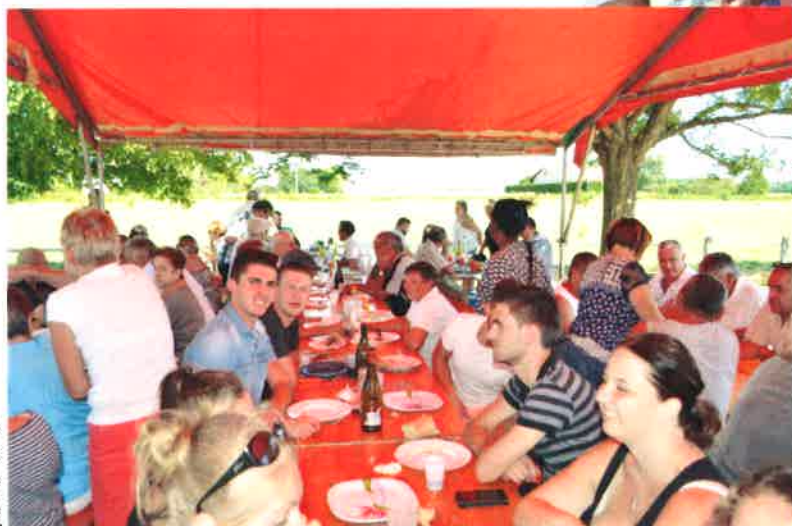
Les convives à table ..